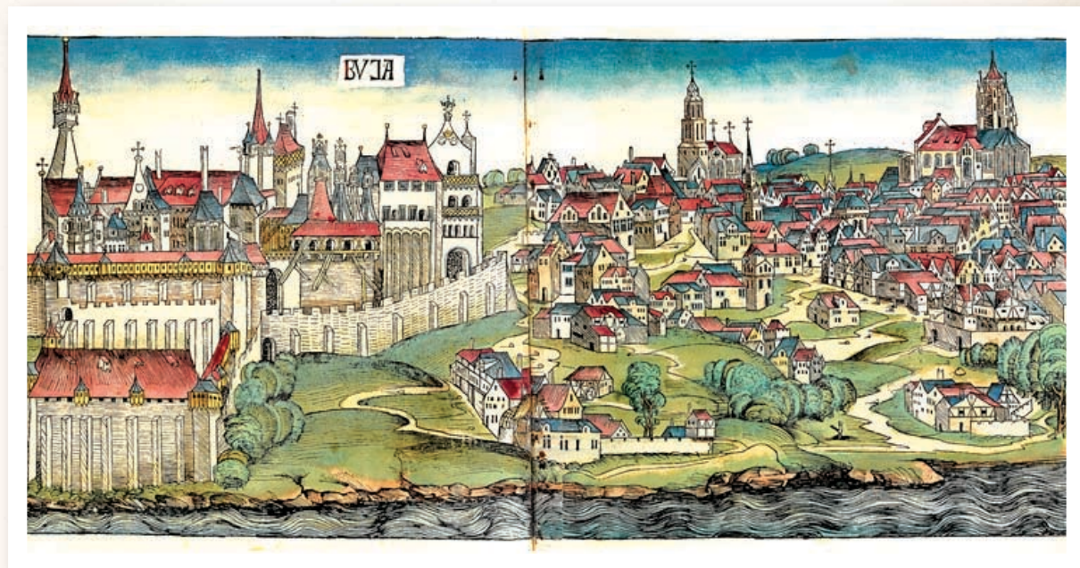
Buda legkorábbi ismert ábrázolása Hartmann Schedel Világkrónikájában (1493)

A korszakunkat felölelő bő évszázadban Magyarország Európa egyik leggazdagabb és legfejlettebb országa volt. Hazánk a nemesfémek kitermelésében az élen járt: a világon fellelhető arany mintegy harmadát a magyarországi bányák adták. Emellett jelentős volt az ezüsbányászat is. Az akkori királyaink által biztosított belső rend kedvezett a földművelés és az állattenyésztés fejlődésének is. A lakosság nagy része mezőgazdasági termeléssel foglalkozott. A parasztok mind több erdőt és mocsaras területet változtattak virágzó termőföldre. Nehézekébe fogott ökrökkel szántottak. A magasabb hegységeken és egyes pusztákon leginkább állattenyésztéssel foglalkoztak. A jobbágyság egyre többet termelt, s így több termést tudtak piacra vinni; kibontakozott a paraszti áruterelés. Fejlődésnek indultak a városok is. Egy-egy városban átlagosan 2-10 ezer ember élt.