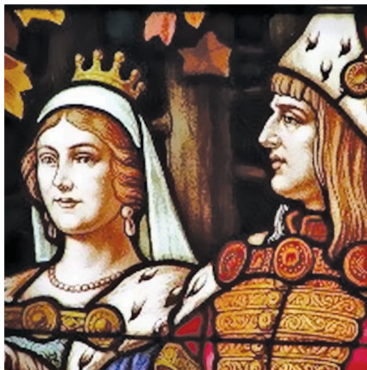
Mátyás király és Beatrix

Mátyás király reneszánsz udvara a lakomákról is nevezetes. Udvari szakácsai túlnyomórészt férfiak voltak, mivel munkájukhoz a vad elejtése, megtisztítása, megnyúzása, feldarabolása is hozzátartozott. A magyar konyha fő jellegzetessége az erős fűszerezés volt, ami az étkek megemésztését is szolgálta. Egy-egy lakoma sok fogásból állt, például Mátyás és Beatrix esküvőjén 24 fogást szolgáltak fel. Hiába ültek az ország előkelőségei asztalnál, mégis sokan összekenték magukat evés közben. A korszakban ugyanis egyetlen evőeszközt használtak, a kést. A menü elmaradhatatlan része volt az édeség, amit mézzel édesítettek. Az étkek elfogyasztása közben és után az elmaradhatatlan bort cserépedényekben kínálták, és a pohárnokok kötelessége volt gondoskodni arról, hogy a vendégek serlege, kupája ne legyen üres. A középkori Magyarországon már több borvidék is létezett, de a legjobb minőségű nedűt a Duna és a Száva között fekvő Szerémségben termelték.