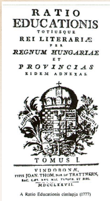
A Ratio Educationis címlapja

ugyanis eltökélt szándéka volt, hogy megadóztassa a nemességet is. Ennek érdekében végrehajtatta az első népszámlálást Magyarországon, és hogy ezt a munkát megkönnyítse, elrendelte az utcákban a házak megszámozását is.