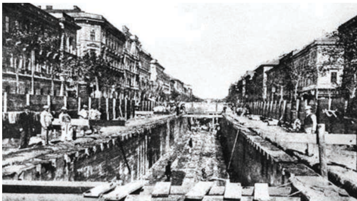
Épül a Millenniumi Földalatti Vasút az Andrassy úton

a halálozási arány tekintetében élen járt Európában. A csecsemőhalandóság mutatói csak kis mértékben javultak, mivel számos halálos gyermekbetegséget (például a diftériát, szamárköhögést, kanyarót) nem sikerült legyőzni. 1910-ben ezer élve született közül kb. kétszáz csecsemő halt meg egyéves kora előtt. Az átlagéletkor a korszakban 27 évre tehető; hatvanadik életévét a társadalom alig 7 százaléka érte meg. 1890-es évektől csökkenni kezdett a születések száma, mivel – főleg a módosabb vidékeken – arra törekedtek, hogy minél kevesebb, lehetőleg egy gyermek szülessen, hogy megakadályozzák a földek aprózódását. Ez volt az úgynevezett egykézés.