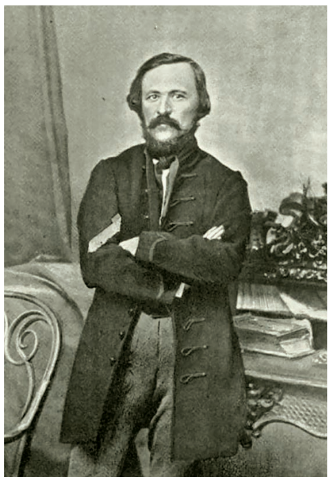
Báró Eötvös József

tek kubikusként vasútépítésnél, folyamszabályozásnál. A gyári munkásság a társadalom alig 5 százalékát tette ki, s főként a főváros munkásnegyedeiben (Angyalföld, Kőbánya, Csepel) élt.