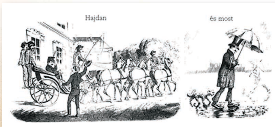
Karikatúra a dzsentriről