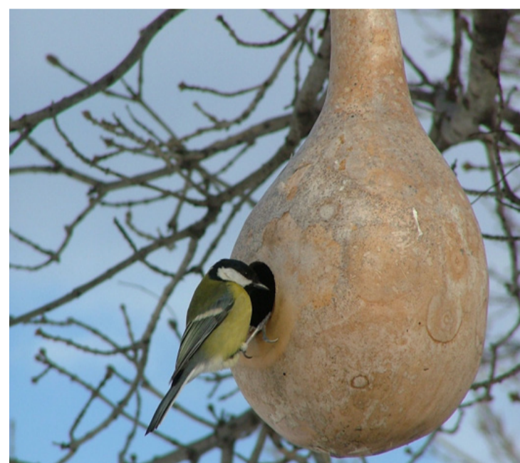
Egy széncinege szemügyre veszi a fára függesztett töklakást. Lehet, hogy ez lesz az?