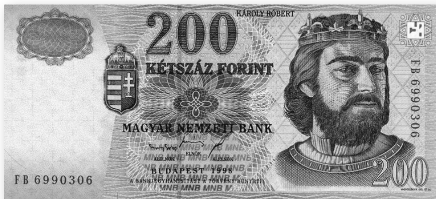
Kétszáz forintos bankjegy

Az anarchiának a kanyargós utat bejárta Anjou családból származó Károly Róbert vetett véget, aki 1308-tól 1342-ig uralkodott. Az Anjouk Franciaország északnyugati vidékéről jutottak el egészen Dél-Itáliáig, Nápolyig, majd onnan föl Magyarországra.