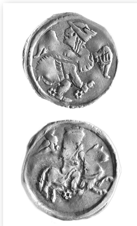
Árpád-kori pénzérme, IV. Béla denárja

A történet a IX. század végén kezdődik, amikor a Kárpát-medencében megjelent egy ismeretlen nép, Árpád vezetésével. Nyelvük nem hasonlított egyetlen régebb óta Európában élő nép nyelvére sem, az idegenek számára furcsa dolgaik és szokásaik voltak. Ruhájukat nem csatokkal, hanem gombokkal fogták össze, lábbelijüknek sarka volt, hogy ki ne csússzon a kengyelből, vállukon kacagányt viseltek. Le nem szálltak volna a lovaikról, melyeknek a hátát, ha kisebesedett a nyeregtől, nyers hússal gyógyították. Félelmetes katonák voltak, a X. században bejárták Európa nagy részét, hogy zsákmányt szerezzenek. Igen, ők voltak a mi elődeink, akik megszerezték számunkra a Kárpát-medencét.