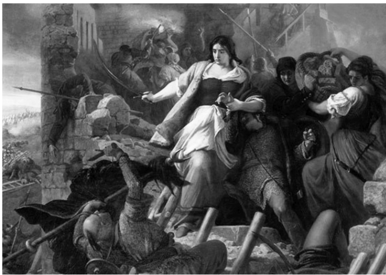
Székely Bertalan festménye: Egri nők

Az Erdélyi Fejedelemség fénykora Bethlen Gábor uralkodásának idejére (1613–1629) tehető. Az ő fejedelemsége idején vált tömegessé az iparhoz jól értő szászok bevándorlása (Brassó), örmény kereskedők