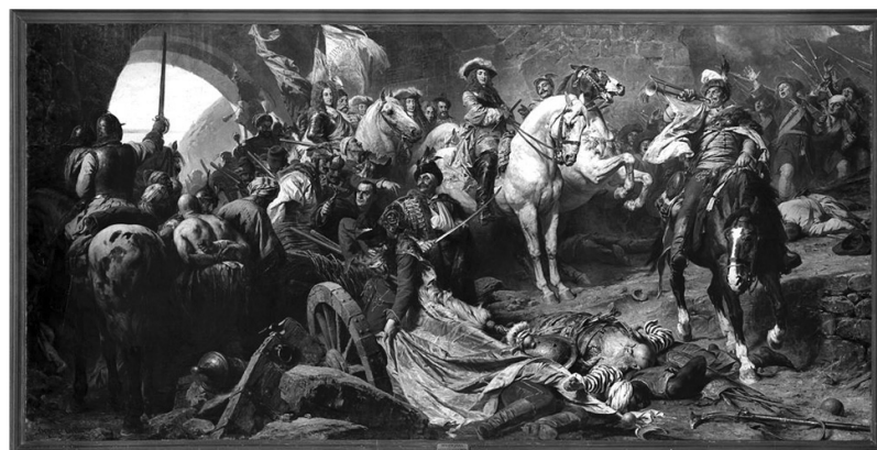
Benczúr Gyula festménye: Budavár visszavétele

A parasztok fő tápláléka továbbra is a gabonafélékből készült kenyér volt, mellette kiemelkedően fontos a káposzta, amelyet már ekkor is savanyítanak. Az Alföldön, amelynek nagy része mocsaras ártér, továbbra is a hal adta az étkezések egyik fő összetevőjét. A nemesség természetesen gazdagabban táplálkozott, a hús náluk naponta része volt az étkezésnek.