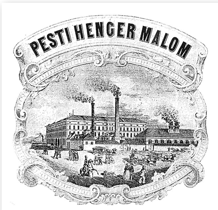
A pesti hengermalom

műveiben Mikszáth Kálmán és Móricz Zsigmond is megörökítette. A parasztság erőteljesen differenciált társadalmi réteg volt, a szegényebbek bér munkát vállaltak. A földnélküliek sokszor építkezéseken dolgoztak, vagy földmunkát végez-