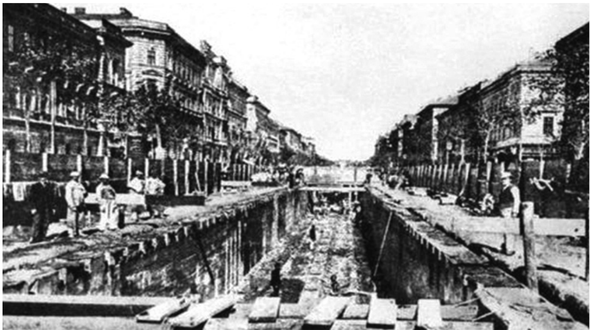
Épül a Millenniumi Földalatti Vasút az Andrassy úton

a halálozási arány tekintetében élen járt Európában. A csecsemőhalandóság mutatói csak kis mértékben javultak, mivel számos halálos gyermekbetegséget (például a diftériát, szamárköhögést, kanyarót) nem sikerült legyőzni. 1910-ben ezer élve született közül kb. kétszáz csecsemő halt meg egyéves kora előtt. Az átlagéletkor a korszakban 27 évre tehető; hatvanadik életévét a társadalom alig 7 százaléka érte meg. 1890-es évektől csökkenni kezdett a születések száma, mivel – főleg a módosabb vidékeken – arra törekedtek, hogy minél kevesebb, lehetőleg egy gyermek szülessen, hogy megakadályozzák a földek aprózódását. Ez volt az úgynevezett egykézés.