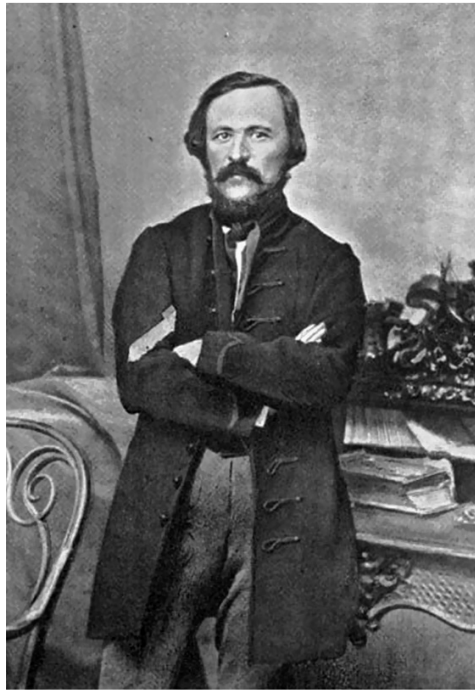
Báró Eötvös József

tek kubikusként vasútépítésnél, folyamszabályozásnál. A gyári munkásság a társadalom alig 5 százalékát tette ki, s főként a főváros munkásnegyedeiben (Angyalföld, Kőbánya, Csepel) élt.